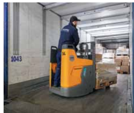
An 113 Rampen werden bei Noerpel in Ulm LKWs be- und entladen.