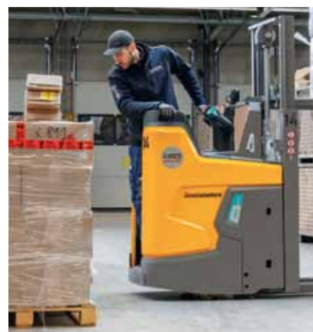
Als größter Vorteil erweist sich in der vollbepackten Umschlaghalle, dass der ERD 220i um 30 Zentimeter kürzer und dadurch erheblich wendiger ist als andere Fahrzeuge seiner Klasse.