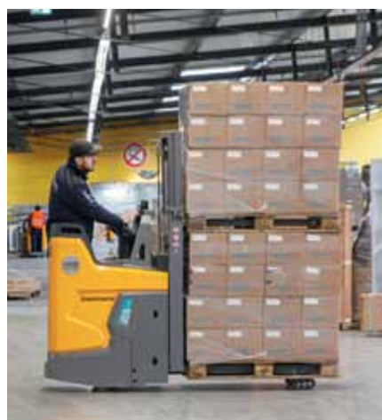
Der ERD 220i ist auch als Doppelstock einsetzbar und kann zwei Paletten übereinander transportieren. Ein erheblicher Effizienzgewinn insbesondere beim Be- und Entladen von Lkw.