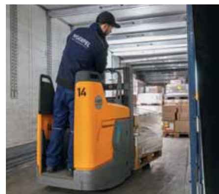
Der ERD 220i ist mit diversen Features für den sicheren und komfortablen Einsatz an der Rampe ausgerüstet.