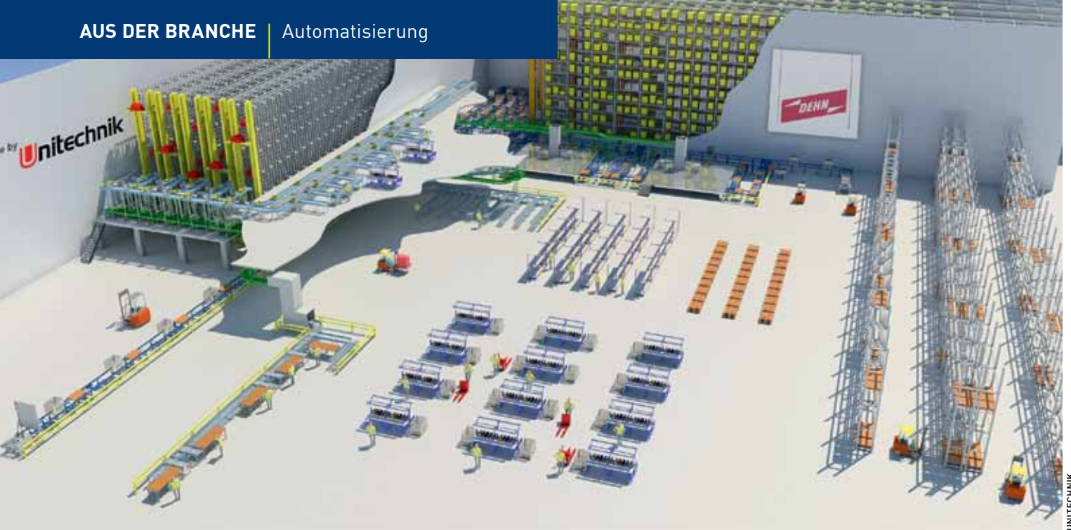
In der Planungsphase wird eine passgenaue Lösung aus einer Vielzahl von möglichen Varianten entwickelt.

bewährt. Außerdem lassen sich mittels Tabellen Lösungen entwickeln, die eine hohe Flexibilität ermöglichen.