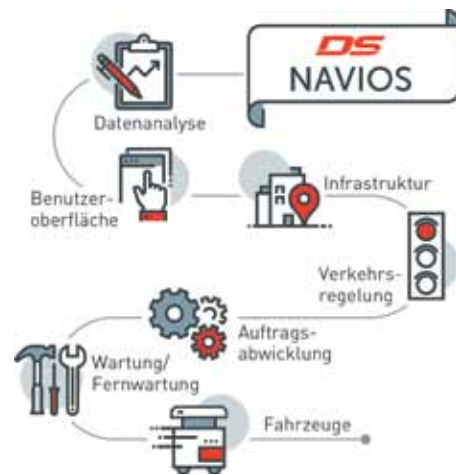
Die FTS-Leitsteuerung „DS Navios“ ist das zentrale Element jeder FTS-Anlage.

Bei spurgeführten Systemen folgen die Fahrzeuge Magnetbändern oder Induktionsschleifen, die in den Boden eingelassen oder – zum Herstellen temporärer Verbindungen – auf diesen aufgeklebt sind. Neben der Navigation können diese auch dem permanenten Nachladen der Batterien in den Fahrzeugen dienen, um Ladezeiten zu vermeiden. Ihre Hauptanwendung liegt in der Fließproduktion, wo sie als Werkstück- oder Plattformträger fest installierte Rollen- oder Hängeförderer ersetzen. So flexibilisieren sie vor allem Montageprozesse. Frei navigierende Fahrerlose Transportfahrzeuge werden meist in klassischen Intralogistik-