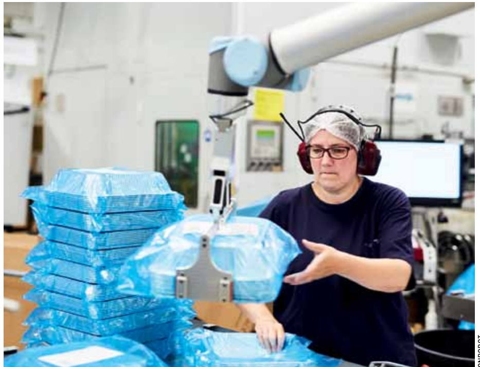
Die kollaborative Applikation von Onrobot arbeitet bei Plus Pack Seite an Seite mit dem Produktionspersonal.

Um diesen Herausforderungen zu begegnen, sind Industrieroboter für Großunternehmen schon lange ein probates Mittel, die Effizienz ihrer Produktion zu erhöhen. Für KMU stellt die Automatisierung bisher noch eine größere Hürde dar, da intern oftmals das nötige Know-How fehlt und wesentlich kleinere Budgets für Investitionen zur Verfügung stehen. Eine neue Generation von kollaborierenden Leichtbaurobotern, sogenannte Cobots, spielt KMU dabei in die Hände. In Kombination mit End-of-Arm-Tools wie Greifern, Werkzeugwechslern und Sensoren bezeichnet man sie als kollaborativen Applikationen. Diese