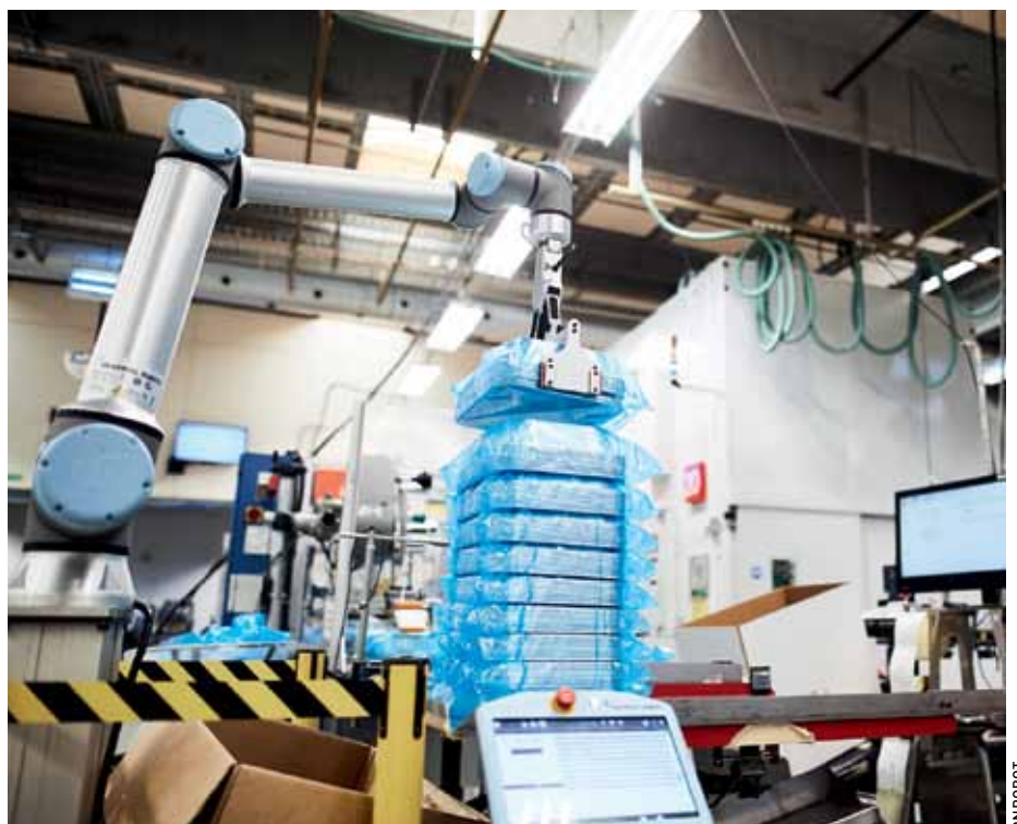
Früher wurden die Stapel von Aluminiumschalen manuell aufeinander gesteckt, um die Luft herauszudrücken. Das übernimmt nun die kollaborative Applikation.